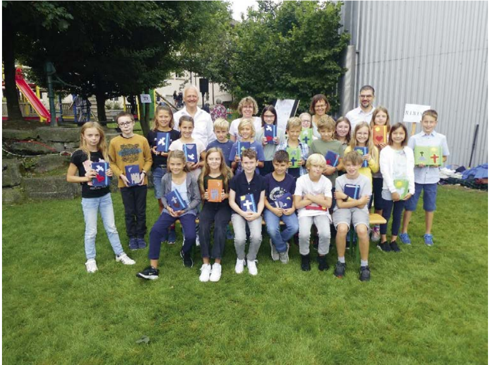
Gemeindetag vom 28. August mit Bibelübergabe an die 5. Klässler

Am 25. September in Bichwil und 30. Oktober in Oberuzwil wurde die Kirche gegen das Zelt bzw. die «alte Gerbi» getauscht und dort der Chilbi-Gottesdienst abgehalten. Musikalisch bereicherte in Oberuzwil der Gospelchor Oberbüren die Feier.