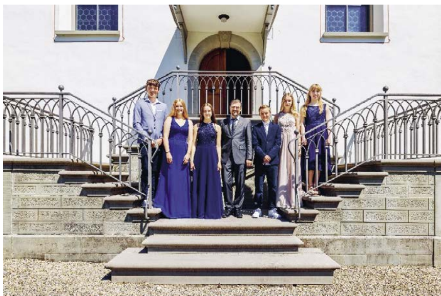
Am 22. Mai und 12. Juni fanden die Konfirmations-Gottesdienste statt.