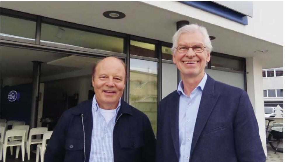
Ökumenischer Werkstatt-Gottesdienst in Schwarzenbach am 23. September