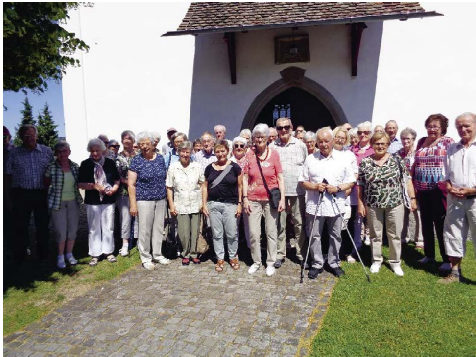
Seniorenausflug vom 14. Juni

Sowohl in Oberuzwil als auch in Jonschwil-Schwarzenbach finden jährlich viele unterschiedliche Aktivitäten für die Seniorinnen und Senioren statt. Angeboten werden musikalische Darbietungen, Theatervorstellungen, Spielnachmittage, Mittagessen etc.