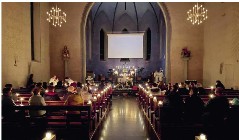
Ökumenischer Rorate-Gottesdienste in Jonschwil am 7. und 8. Dezember