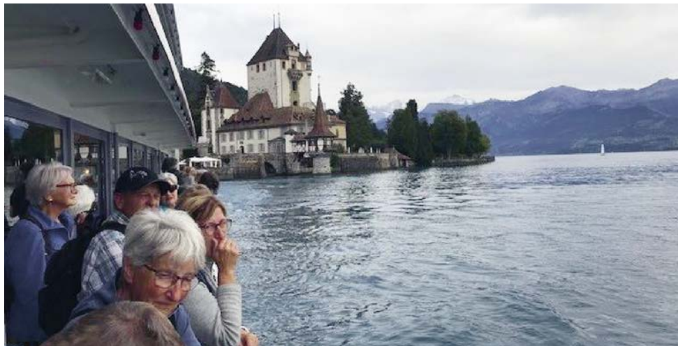
Gemeindereise nach Gstaad