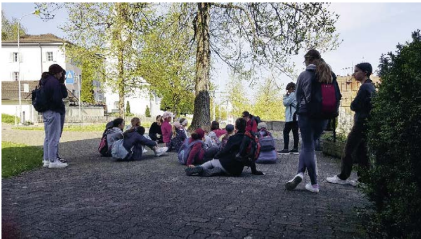
Kindertag im Walter Zoo